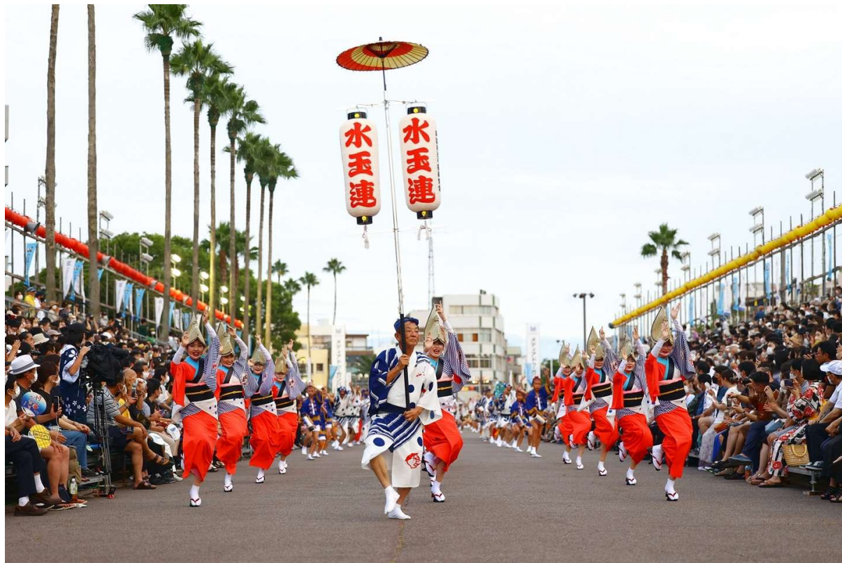
▲プレミアム棧敷席が設置される藍場浜演舞場

アソビュー株式会社（所在地：東京都品川区、代表執行役員CEO：山野智久、以下、当社）は、2023年8月12日（土）から8月15日（火）の期間で開催される「2023阿波おどり」のインバウンド向けに最高級棧敷席「AWAODORI hospitality seat」を、阿波おどり未来へつなぐ実行委員会と共同で造成し、外国人観光客向けに2023年6月15日（木）より販売いたしますことをお知らせいたします。